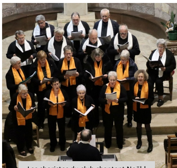
Les choristes du club chantent Noël !

Ce sont 123 adhérents qui, en 2025, sont affiliés à cette dynamique association.