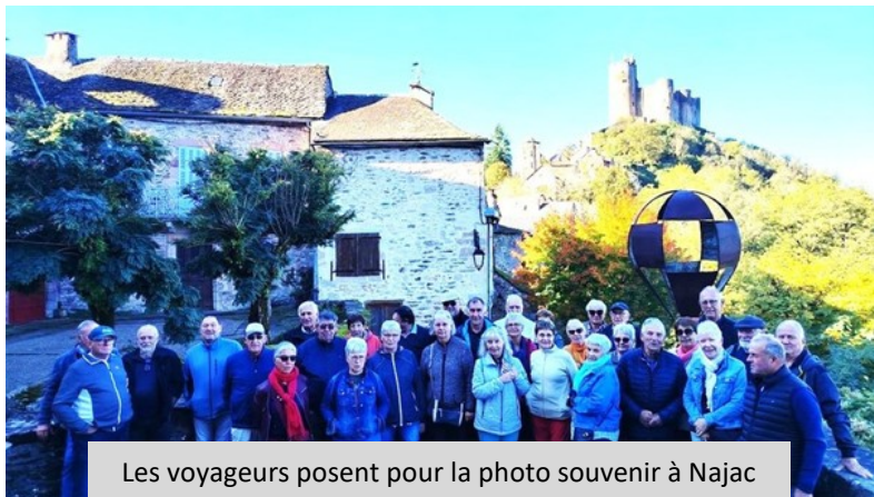
Les voyageurs posent pour la photo souvenir à Najac

Les membres de « La Fleur des Caussees » aiment se retrouver autour d'une bonne table ; c'est le cas évidemment pour l'AG au mois de février ou mars, c'est aussi le cas lors des ateliers cuisine, chaque mois en principe, où les convives viennent déguster et commenter les plats préparés par l'équipe du jour.