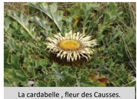
La cardabelle, fleur des Caussees.