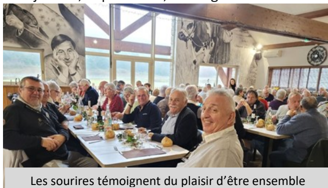
Les sourires témoignent du plaisir d'être ensemble

Nul doute que 2026 ne continue dans cette lancée ! Le 8 janvier, l'après-midi, échange de vœux autour d'une dégustation de galettes maison. Le 15 février, journée de l'AG, journée de fête pour le club ; puis « l'estofinade » suivra... Et en 2026, il y aura la fête des 50 ans de « La Fleur des Caussees ». Chut ! Elle se prépare ! Il y a aussi la participation au programme national « 50 ans, 50 tonnes de déchets ! » Le principe est simple : organiser partout en France des marches de collecte de déchets plastiques, entre mai et octobre 2026, avec pour ambition de rassembler, sur le territoire national, 50 tonnes de déchets plastiques. "Un défi à la fois symbolique, fédérateur... et salubre pour notre planète !" Le club de Saint Saturnin est partant pour relever ce défi !