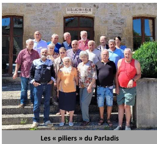
Les « piliers » du Parladis

Les échanges portent sur les paysages, les familles, ceux qui sont partis et ceux qui sont restés. Toujours avec humour, car au Parladis, on sait que : « rire aide à apprivoiser le temps qui passe ».