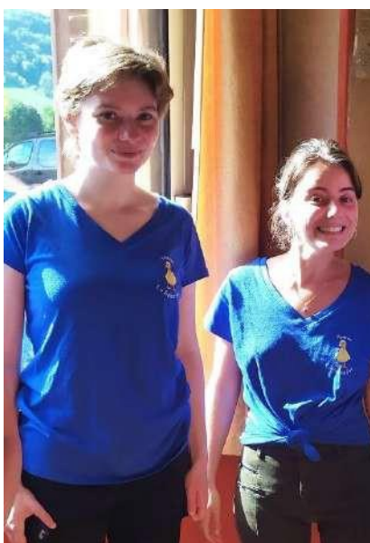
Les mascottes du bistrot.