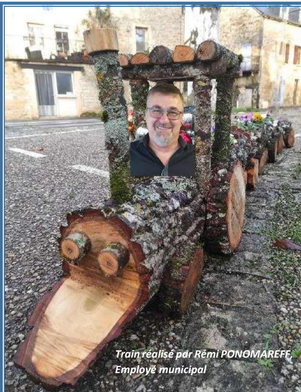
Train réalisé par Rémi PONOMAREFF Employé municipal

DÉCÈS : Mauricette ANDRIEU, le 7 octobre Michel MIRMAND, le 17 octobre Odette CAYZAC, le 26 novembre