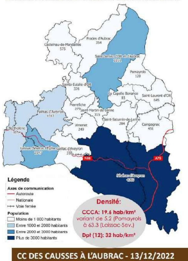
POPULATION DE LA COMMUNAUTE DE COMMUNES DES CAUSSES à L'AUBRAC EN 2019

Dès lors, l'accueil de nouveaux arrivants, souvent de l'Aveyron, constitue un enjeu stratégique majeur pour le développement de notre territoire !